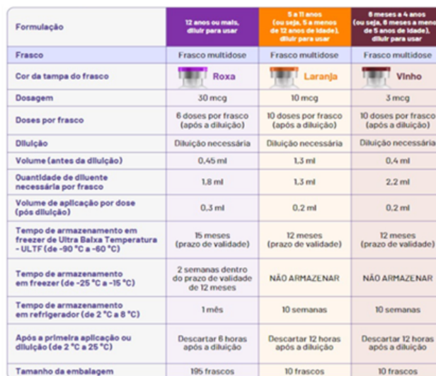
Figura 2 - Apresentação da vacina Comirnaty (covid-19) Pfizer.

Referência: bula do produto < https://www.pfizer.com.br/bulas/comirnaty >